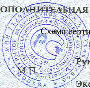
Схема сертификации 4с